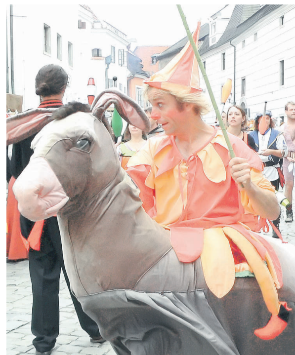
PŘEHRŠLE ZÁBAVY. Slavnosti pětileté růže v Českém Krumlově díky pořadatelům a množství nadšenců pořád drží latku hodně vysoko. Návštěvníci nevěděli, co si vybrat dřív. Fotogalerie na www.ceskokrumlovsky.denik.cz